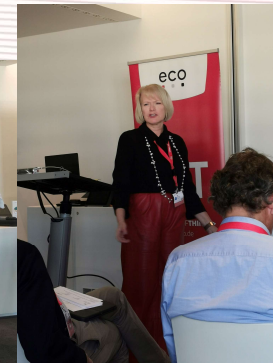
IoT Business Trends: Gamechanger Connectivity