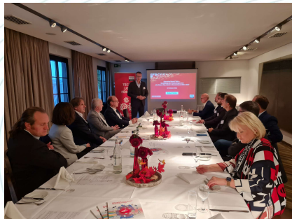
Executive Roundtable & Business Dinner