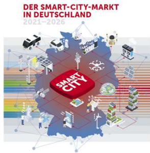
Studie: Der Smart-City-Markt in Deutschland 2021-2026