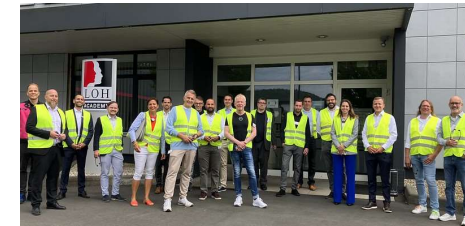
IIoT in der Praxis: Essenzielle Bausteine der Industrie 4.0